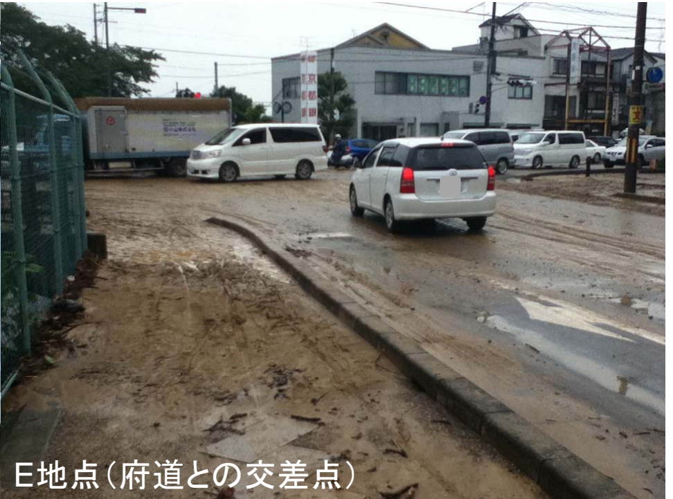
E地点(府道との交差点)