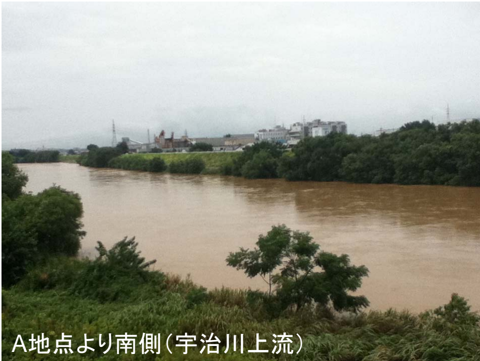
A地点より南側(宇治川上流)